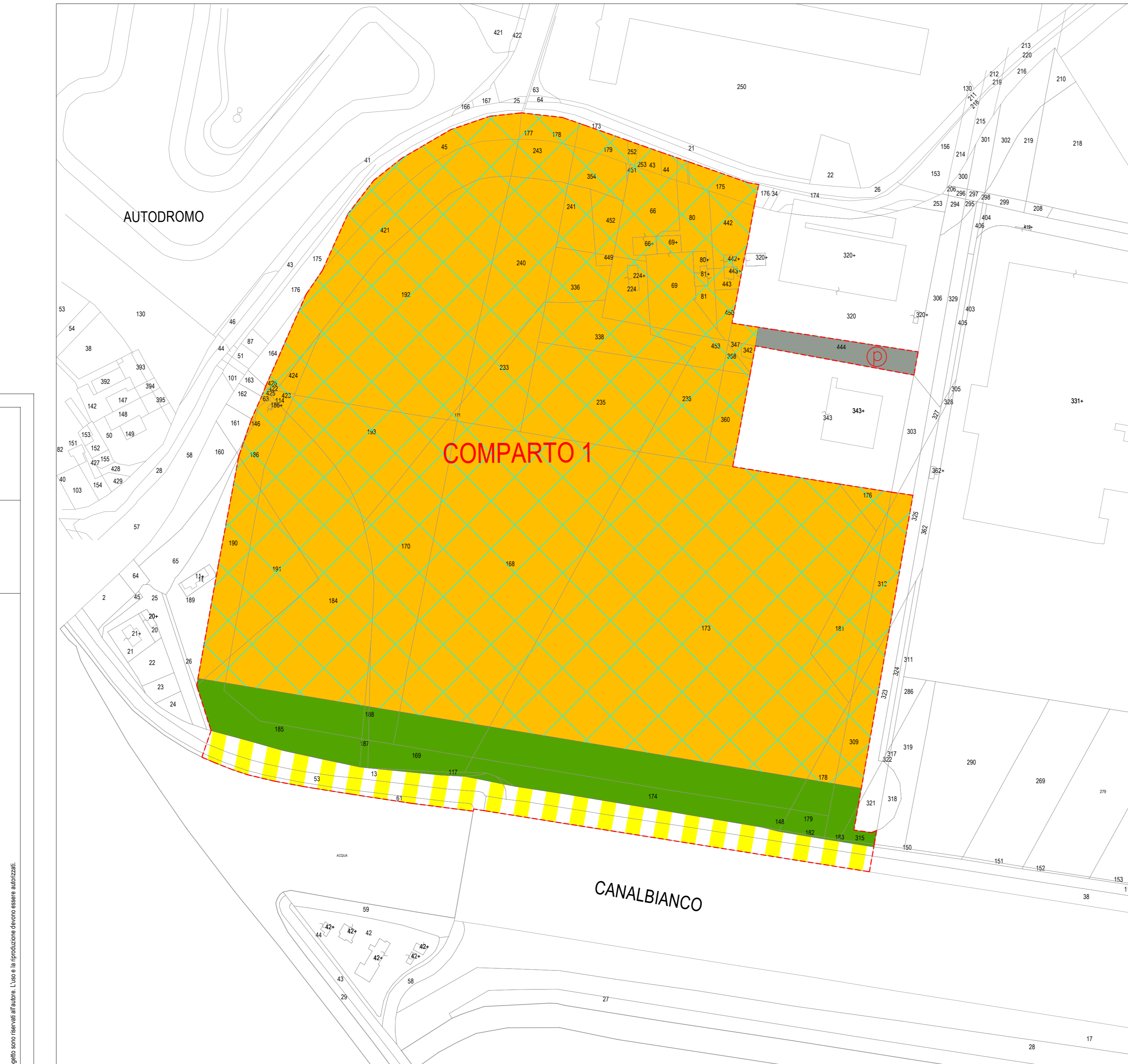
PLANIMETRIA DELLA ZONIZZAZIONE - COMPARTO 1