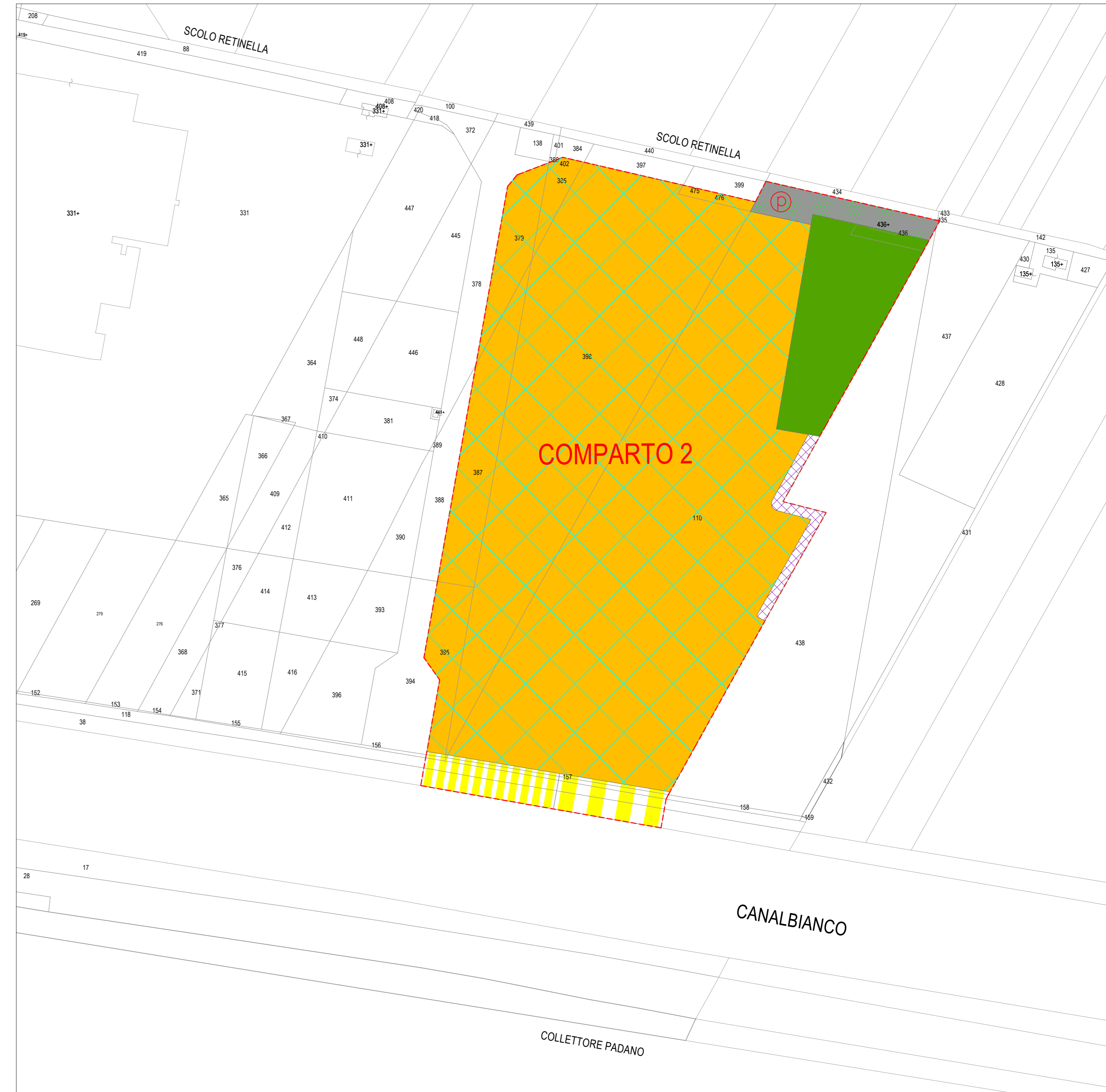
PLANIMETRIA DELLA ZONIZZAZIONE - COMPARTO 2