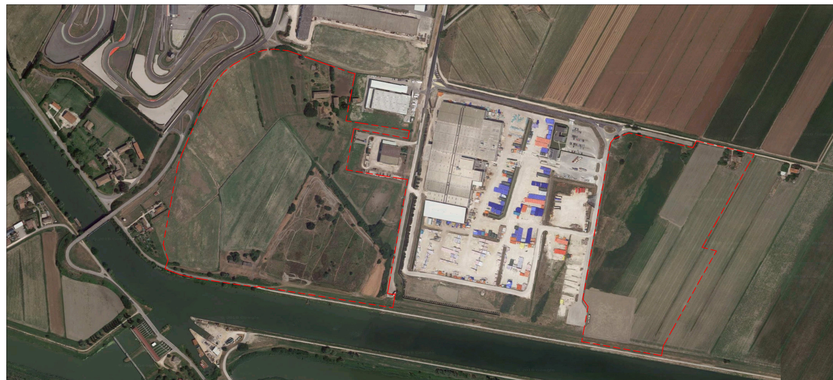
ESTRATTO DI ORTOFOTO - Scala 1:5000