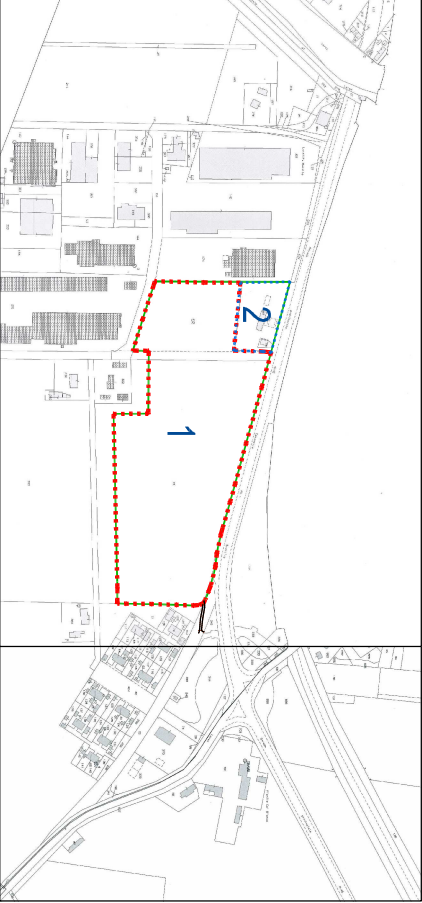
ESTRATTO DI MAPPA CATASTALE - UNITÀ MINIME DI INTERVENTO