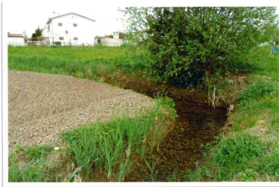
10 - Particolare fosso (angolo sud-est dell'ambito di proprietà)