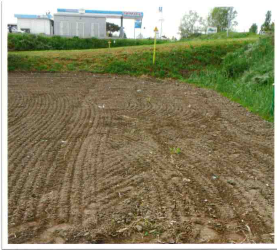
09 - Particolare imbocco capezzagna dalla Strada Provinciale