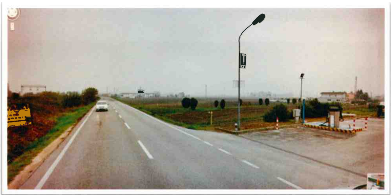
03 - Vista dell'area oggetto di intervento