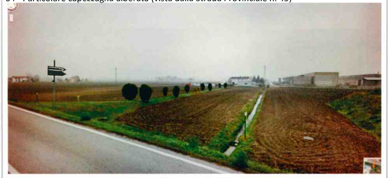
04 - Particolare capezzagna alberata (vista dalla Strada Provinciale n. 45)